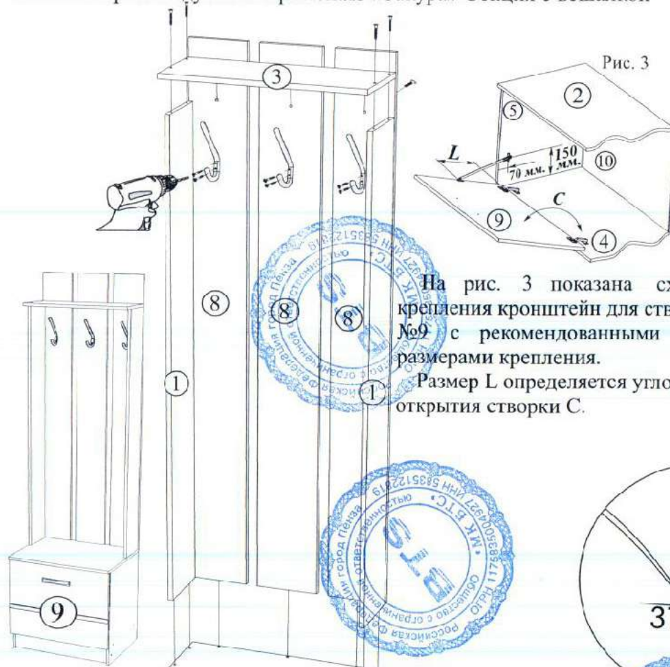
Рис. 3 На рис. 3 показана схема крепления кронштейнов для створки №9 с рекомендованными размерами крепления. Размер L определяется углом открытия створки С.