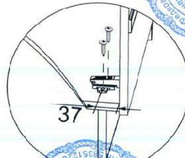
Рис. 2 На рис.2 показан рекомендуемый размер для крепления крестовины петли к вязке №4.

Рис. 3 На рис. 3 показана схема крепления кронштейнов для створки №9 с рекомендованными размерами крепления. Размер L определяется углом открытия створки С.